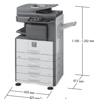
*1.085 mm con vassoio di uscita esteso. Modello con opzioni.